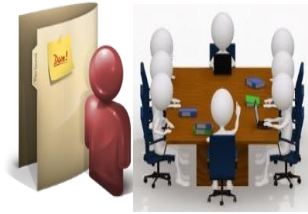
RER Aprueba Plan Anual de Trabajo PPR 2018