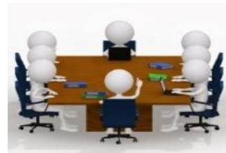
Reuniones de Trabajo de Equipo Técnico