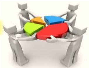
Un (01) Taller de Diagnóstico y Programación de Proyectos - Equipo Técnico