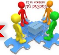
Informe de Agentes Participantes aptos