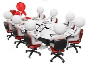
Reuniones de Coordinación y/o Articulación con Gobiernos Locales