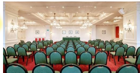
Un (01) Taller de Formalización de Acuerdos y Compromisos PPR