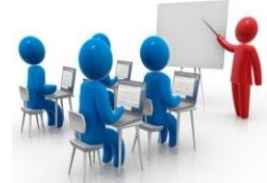
Tres (03) Talleres de Sensibilización y Capacitación