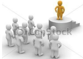
Tres (03) Taller de Rendición de Cuentas