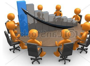
Sesión del CCR – Presenta y Valida Plan Anual PPR