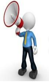
Convocatoria Pública PPR