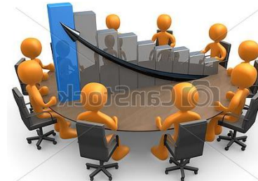
Sesión del CCR – Presenta y Valida PPR en PIA 2018