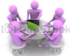
Ingreso proyectos en el PIA 2018